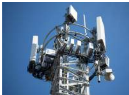
ИТ, телеком и медицинское оборудование