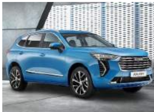
Автотранспорт и спецтехника